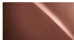
4Y5 MEDENÁ SONIC