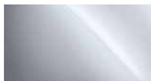
1L2 IRÍDIOVÁ SONIC